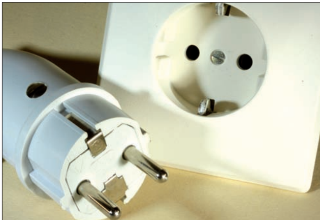
Den richtigen Anschluss finden Händler bei vielen ITK-Distributoren

Und dieses Engagement bringen offensichtlich nicht alle Händler auf, vielleicht auch deshalb, weil viele nicht auf den Verkauf von Energieprodukten angewiesen sind. Dabei lassen sich – die zweifellos erforderliche Begeisterung für Neues vorausgesetzt – damit etliche Euro zusätzlich verdienen. Abschlussprovisionen von mehr als hundert Euro sind ohne Weiteres möglich. Bei PortalHaus, dem Energiedistributor, mit dem alle von Telecom Handel befragten TK-Großhändler zusammenarbeiten, sind durch-